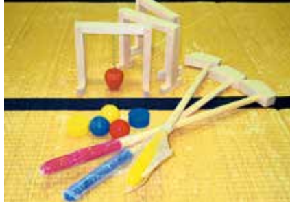
屋内ゲートボール