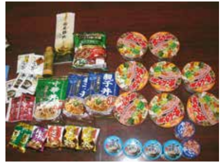
【例】昨年度提供食糧