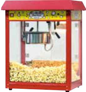
ポップコーン製造機

各団体やサークル、町内会や子ども会等のイベント、交流会での催し物で活用できるレクリエーション用品を無料で貸出しています。事前予約と申請書類の提出が必要となりますので、まずはお電話にてお問合せください。