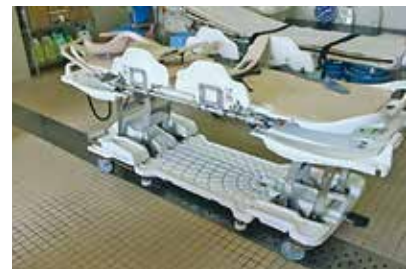
「特殊浴槽本体」と 「電動昇降ストレッチャー」です